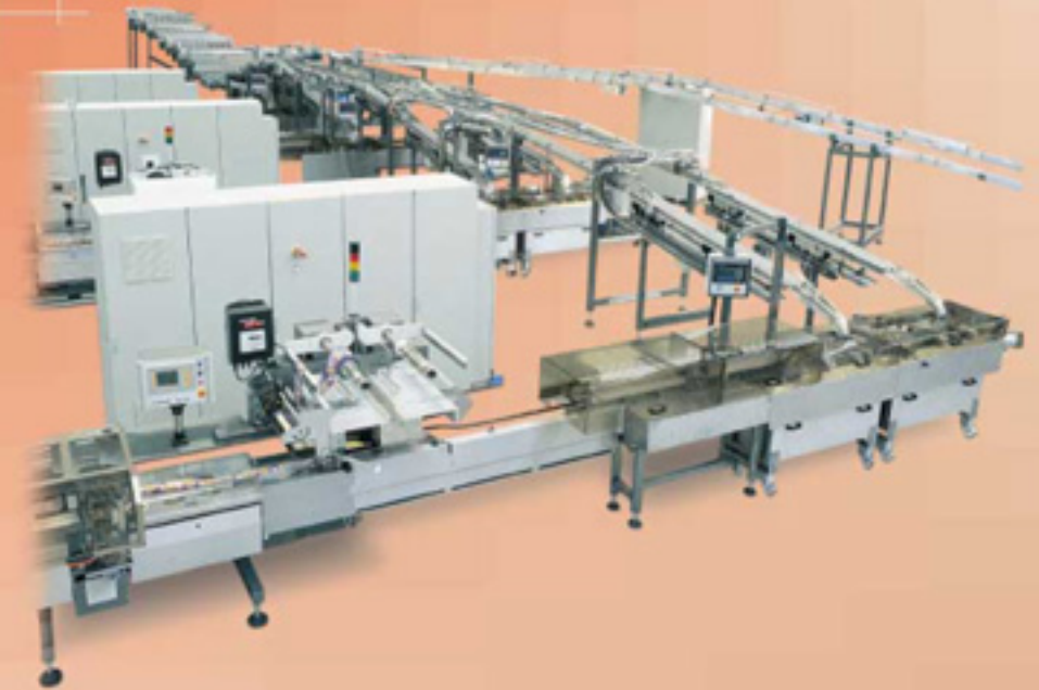
Sandwiching and Wrapping line Linea di farcitura e confezionamento